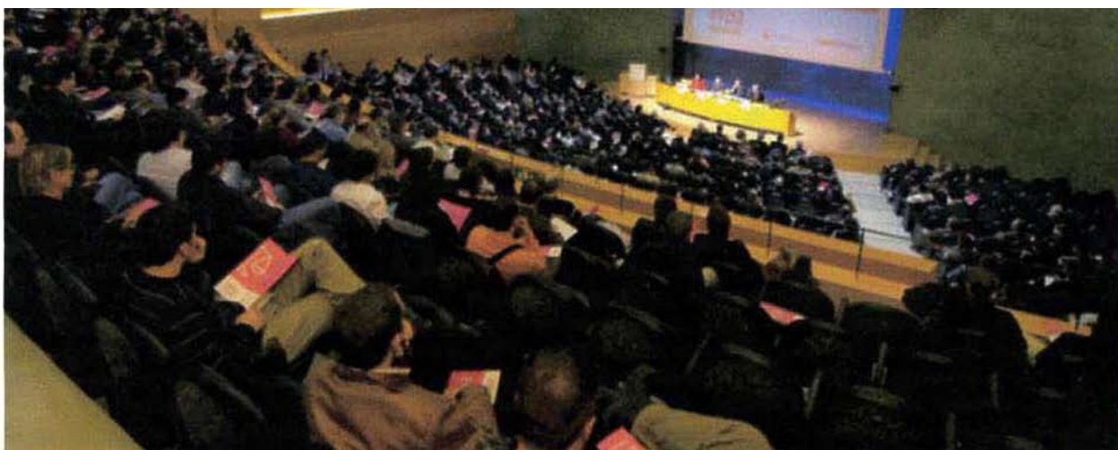
ELS MÀXIMS REPRESENTANTS DEL MÓN JURÍDIC VAN EXPLICAR EL SEU PUNT DE VISTA SOBRE LES RESPONSABILITATS DERIVADES DE L'ACTUACIÓ PROFESSIONAL.