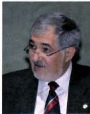
CÁNDIDO CONDE PUMPIDO VA EXPLICAR LA POSICIÓ I L'ACTUACIÓ DE LA FISCALIA EN MATÈRIA DE SINISTRALITAT LABORAL.