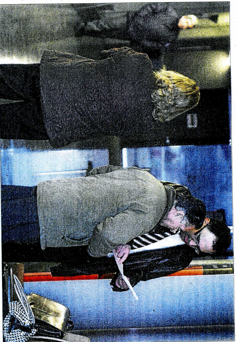
El abogado del arquitecto municipal hablaba con su cliente ayer en el juzgado. / ANTONIO MORENO

El aparejador dijo a la magistrada que «firmaba las certificaciones, pero nunca estubo a pie de obra», abundó la letrada, quien añadió que «no ha sabido o podido justificar por qué lo hizo». El abogado defensor del aparejador, Sergio Mercé, defendió a este diario que fue «la arquitecto